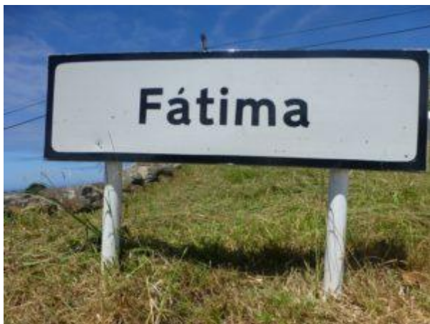
1917-2017: 100 Jahre Fatima

Angesichts solcher Perspektiven sind auch die konservativen europäischen Parteien gespalten.