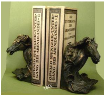
Oswald Spengler: Der Untergang des Abendlandes

Die Charta der Grundrechte der Europäischen Union , die vom Europäischen Rat im Dezember 2000 in Nizza proklamiert wurde und 2009 Rechtskraft erhielt, weist nicht nur jeden Bezug auf die religiösen Wurzeln Europas zurück, sondern trägt eine abgrundtiefe Leugnung der natürlichen, christlichen Ordnung in sich. In ihrem Artikel 21, mit dem das Verbot jeder Art von Diskriminierung „sexueller Neigungen“ eingeführt wurde, enthält sie in nuce die Legalisierung einer Straftat namens Homophobie und der homosexuellen Pseudo-Ehe.