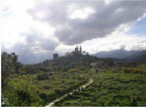
Hippo Regius, neben den Ruinen der Bischofskirche des hl. Augustinus erhebt sich heute eine katholische Basilika

Spengler, überzeugt vom unabwendbaren Niedergang des Abendlandes, erinnert an einen Satz Senecas: Ducunt volentem fata, nolentem trahunt (Den Willigen führt das Schicksal, den Unwilligen zerrt es mit sich). Der relativistischen und deterministischen Sichtweise Spenglers setzen wir jene des heiligen Augustinus entgegen, der – während die arianischen Vandalen Hippo belagerten – den Sieg der immer von der Göttlichen Vorsehung geleiteten Stadt Gottes in der Geschichte verkündete.