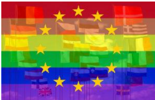
EU und die Homo-Diktatur

Innerhalb der EU drückte Großbritannien auf die Bremse, um die deutsch-französische Absicht, einen „europäischen Superstaat“ zu schaffen, einzubremsen. Gleichzeitig drückte es aber auf das Gaspedal, um europaweit die eigenen „zivilen Errungenschaften“, von der Abtreibung bis zur Euthanasie, von der Adoption für Homosexuelle bis zur Genmanipulation durchzusetzen.