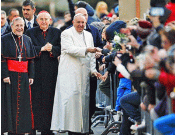
Kontrast zwischen den Kirchenvätern und dem derzeit von einem Papst auf die Spitze getriebenen „Geist des Konzils“

die für den kirchlichen Glauben wesentlich ist, ist für den Leser in diesem Zusammenhang besonders schmerzlich erkennbar.