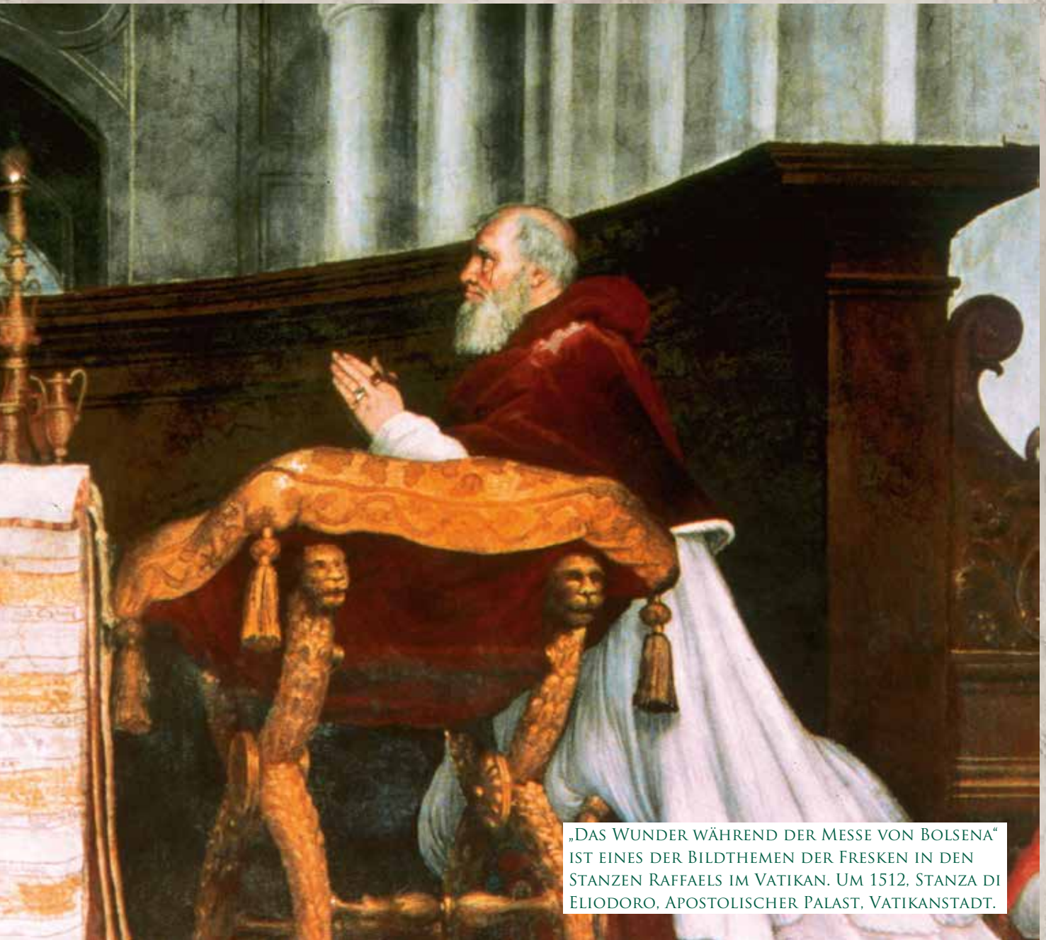
„DAS WUNDER WÄHREND DER MESSE VON BOLSENA“ IST EINES DER BILDTHEMEN DER FRESKEN IN DEN STANZEN RAFFAELS IM VATIKAN. UM 1512, STANZA DI ELIODORO, APOSTOLISCHER PALAST, VATIKANSTADT.

und Reue verlangen, nicht aber das einzige, was Bekenntnis und Reue glaubwürdig macht, die Beendigung des ehebrecherischen Verhältnisses. So als hätte Jesus zur Ehebrecherin gesagt: „Ich will dich nicht verurteilen. Sündige fröhlich weiter. Mit der Zeit wird auf deine Beziehung Gottes Segen herabkommen.“ Das hieße: Bedingung der eucharistischen Gemeinschaft ist letzten Endes nicht Reue und Vorsatz, sondern Zeit und Gewohnheit.