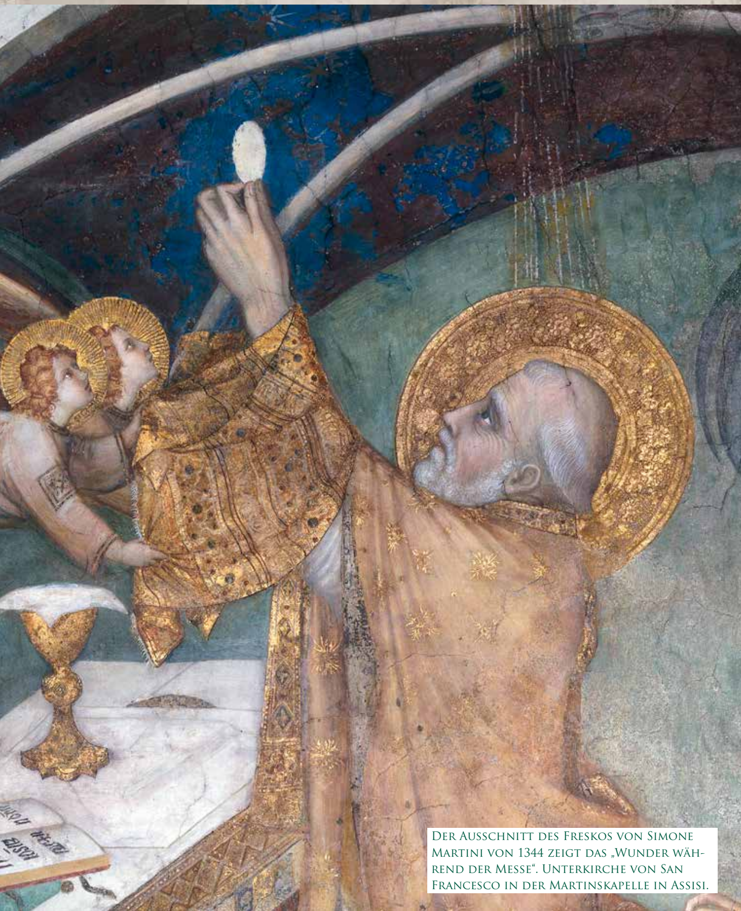
DER AUSSCHNITT DES FRESKOS VON SIMONE MARTINI VON 1344 ZEIGT DAS „WUNDER WÄHREND DER MESSE“. UNTERKIRCHE VON SAN FRANCESCO IN DER MARTINSKAPELLE IN ASSISI.